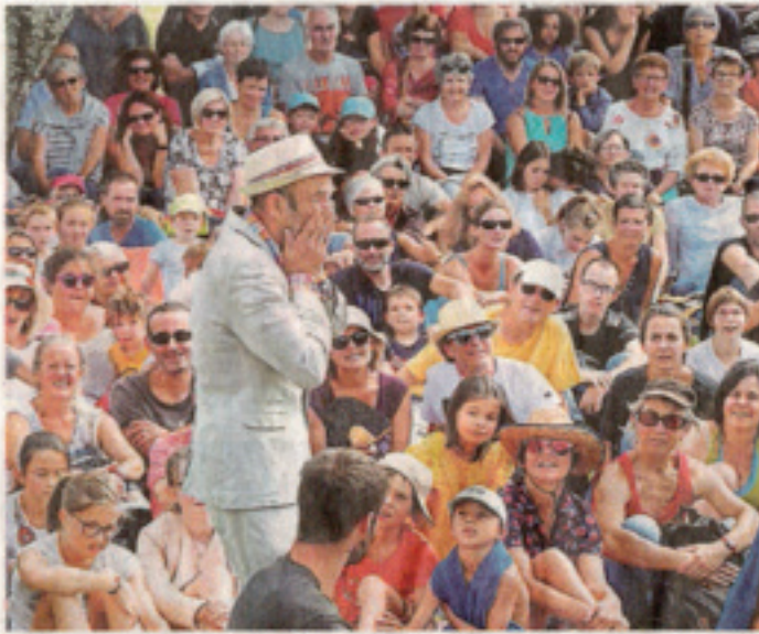
Le public a adoré les rêves colorés de L'Être recommandé .